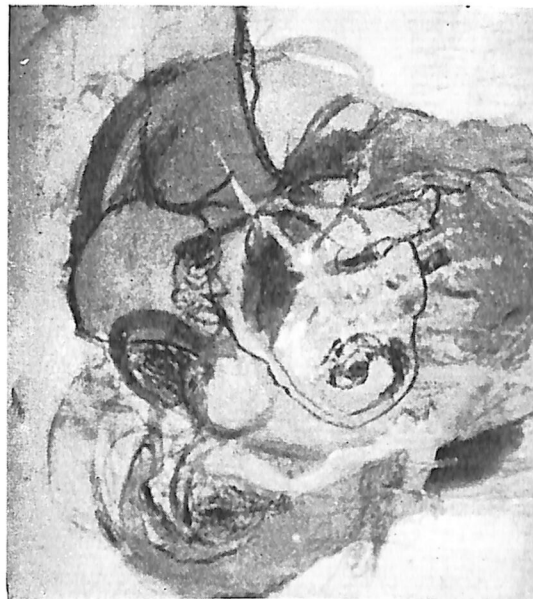
13. Čvor nonsensa tempera-ulje-kreda 1965.

Rodena 1938. u Zagrebu. Završila Akademiju likovnih umjetnosti u Zagrebu 1962. Suradnik je Majstorske radionice K. Hegedušća. Izlagala na izložbama ULUH-a, na izložbama Majstorske radionice K. Hegedušća u Zagrebu (1963. i 65.), Rijeci, Splitu, Ečki i Subotici (1964.), na I trijenalu suvremenog jugoslavenskog crteža u Somboru 1963., na izložbi slikarica u čast 8. marta u Zagrebu, te na III bijenalu mladih u Rijeci 1964. Na III bijenalu suvremene jugoslavenske grafike u Zagrebu prošle godine primila je otkupnu nagradu. Samostalno je izlagala u Zagrebu 1963.