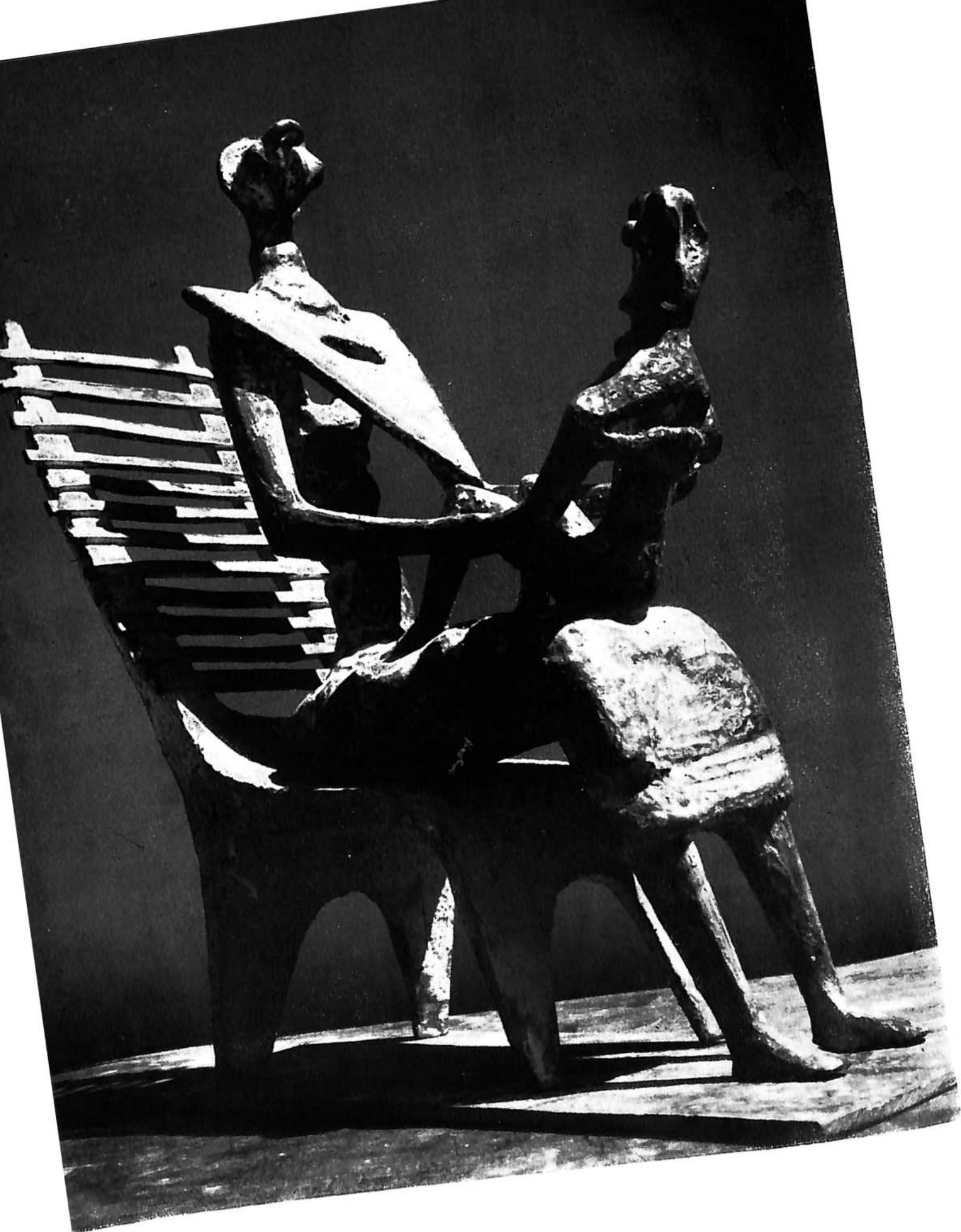
MAJKA I DETE, 1952