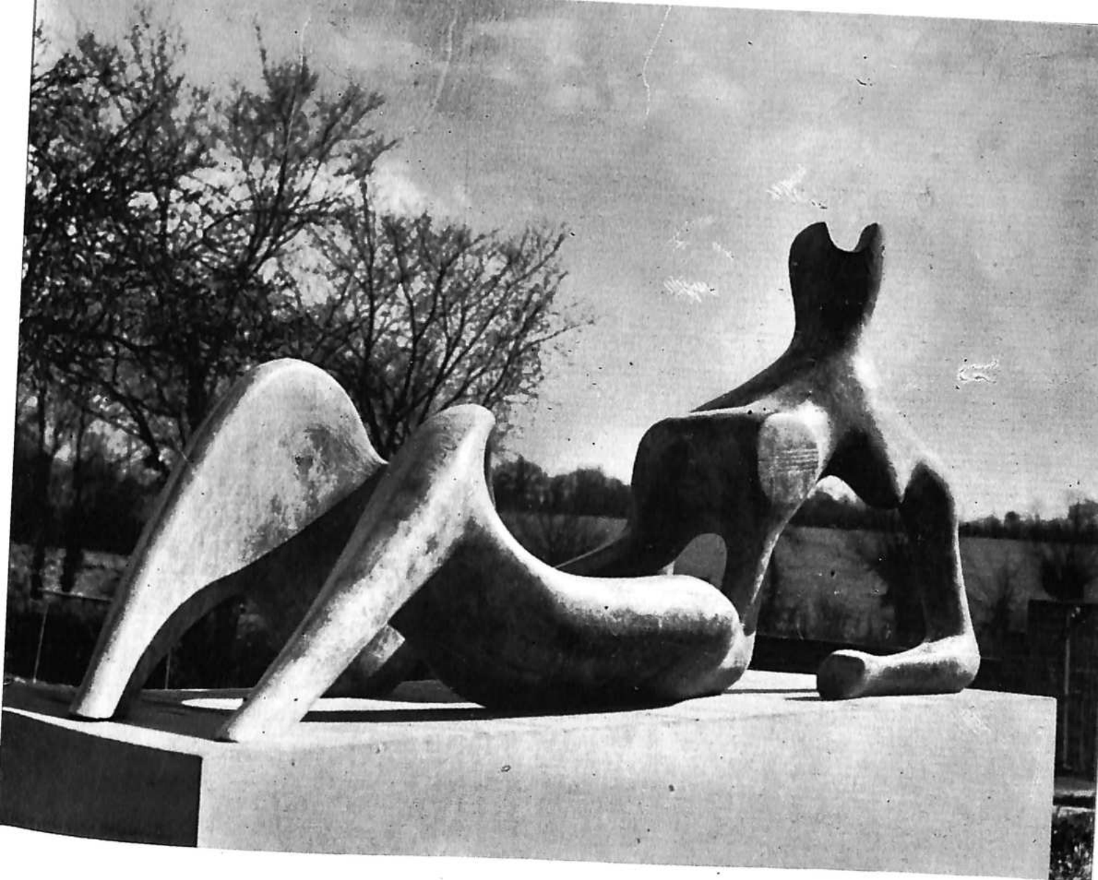
FESTIVALSKA LEŽEĆA FIGURA, 1951